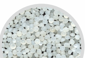
ПЭТ гранулят вторичный