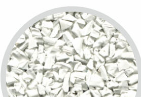
АБС пластик дробленый